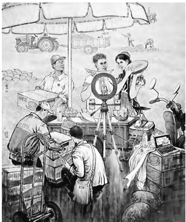
奋斗者正青春(国画)

㉝ Liu, Z., & Berkowitz, D. (2018). Blurring boundaries: Exploring tweets as a legitimate journalism artifact. Journalism , 21(5), pp. 652-669.